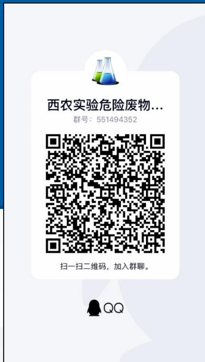
危险废弃物回收通知群