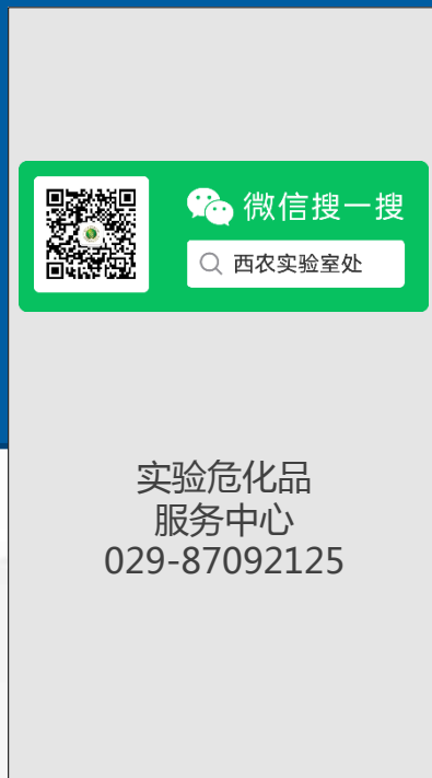
微信公众号及联系方式