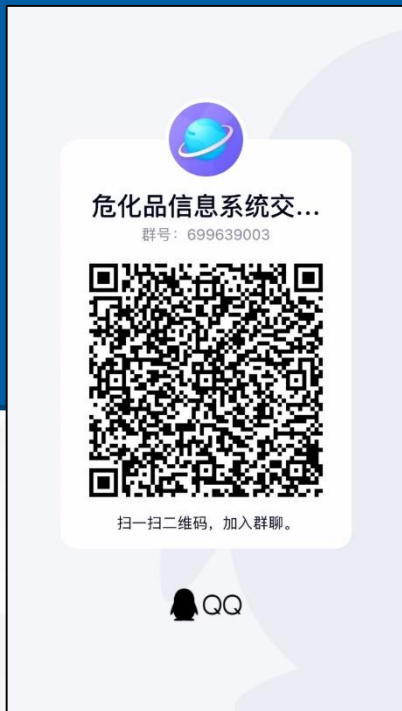
信息系统使用交流群